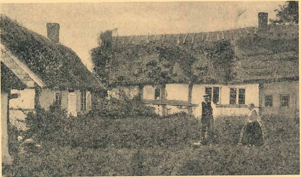
GAMMAL SKÅNSK GÅRD